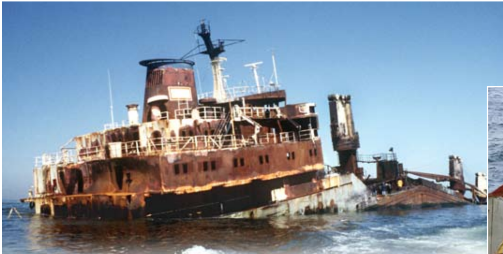
Fremdkörper im Wattenmeer: Das Wrack der Pallas vor Amrum (1999) und die Greenpeace-Aktion am Sylter Außenriff (2008).