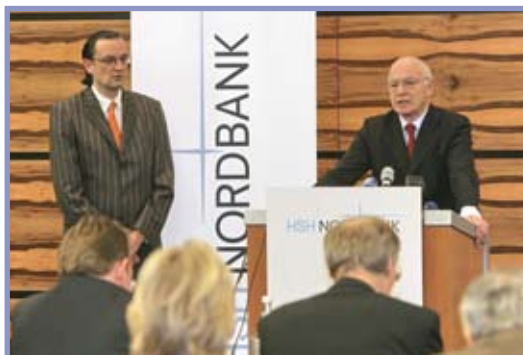
Der Vorstandsvorsitzende der HSH-Nordbank Hans Berger (rechts) musste im November das Ruder der Bank abgeben, die dem Land Schleswig-Holstein und Hamburg gehört.

wiesene Dividenden und das Mäzenatentum der Bank“ den kritischen Blick getrübt habe. Doch damit sei es sowieso vorbei: „Die HSH Nordbank ist für das Land auf Jahre hinaus kein Goldesel mehr.“ Bereits im anstehenden Haushalt für 2009/2010 fehlten „Sum-